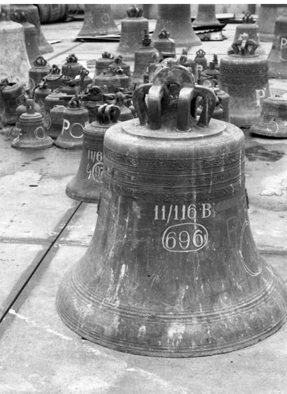
Afb. 6. Kerkklok uit de RK kerk O.L.V. ten Hemelopneming in Nieuwkoop, bestemd voor de smeltoven van Duitse metaalbedrijven. Klok uit 1534, gegoten door Jan Tolhuis.

De IJsselsteinse raadhuistorenklok is in 1542 gegoten, nog vóór de bouw van het raadhuis in 1560. Het opschrift luidt: "Sinte Pavlus is myn naem; myn ghelwt is voer God beqvaem IAN TOLHWS 1542." (Sint Paulus is mijn naam; mijn geloften zijn voor God geschikt. Jan Tolhuis 1542.) Sint Paulus wordt gekozen als patroonheilige, symbool van geloof en standvastigheid. De klok functioneert niet alleen als tijdsinstrument, maar is daarmee ook uitdrukking van religieuze toewijding en stedelijke identiteit. Het is zeer wel mogelijk dat de luidklok in de jaren vóór 1560 in de Pasqualinitorren van de oude Nicolaaskerk heeft gehangen.