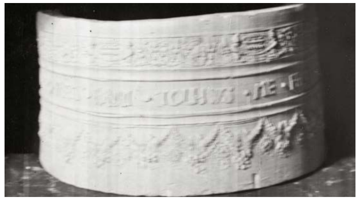
Afb. 2a en 2b. Detailopnamen van de IJsselsteinse klok van 1542, met renaissance-ornamenten en religieus opschrift.