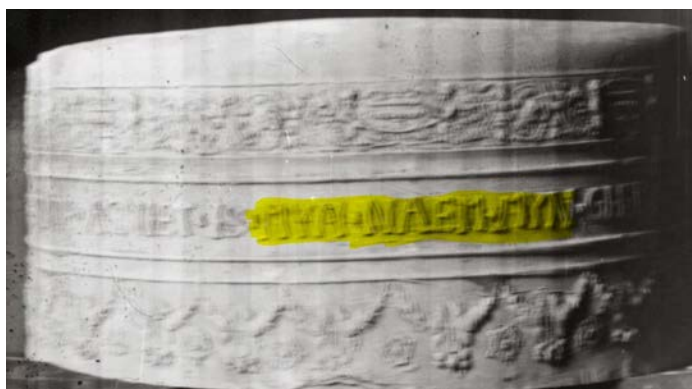
Afb. 3. Fragment van het opschrift van de klok, met de woorden "myn naem, myn" geel gemarkeerd.