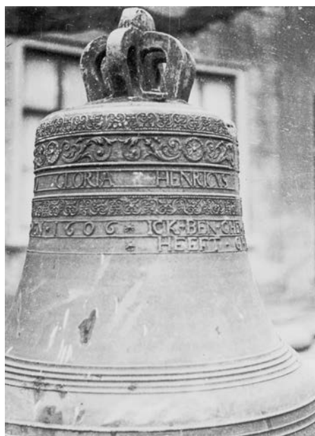
Afb. 1. Opname uit 1943 vanuit de Utrechtsestraat, kort voor de klokvordering door de Duitse bezetter op 12 februari 1943. Op de klok een deel van het opschrift "GLORIA HENRICVS" [...] "1606 ICK BEN GH..HEEFT."

Pas sinds kort is het volledige opschrift van deze luiddklok bekend: "Soli deo gloria Henricus Meurs me fecit 1606."